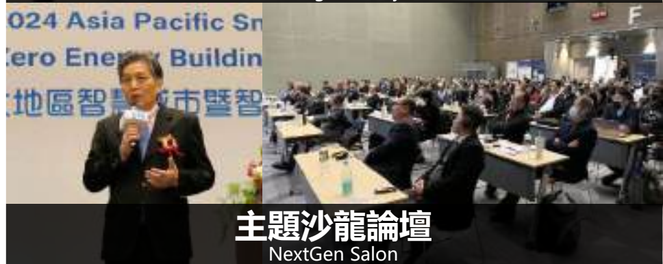
主題沙龍論壇 NextGen Salon