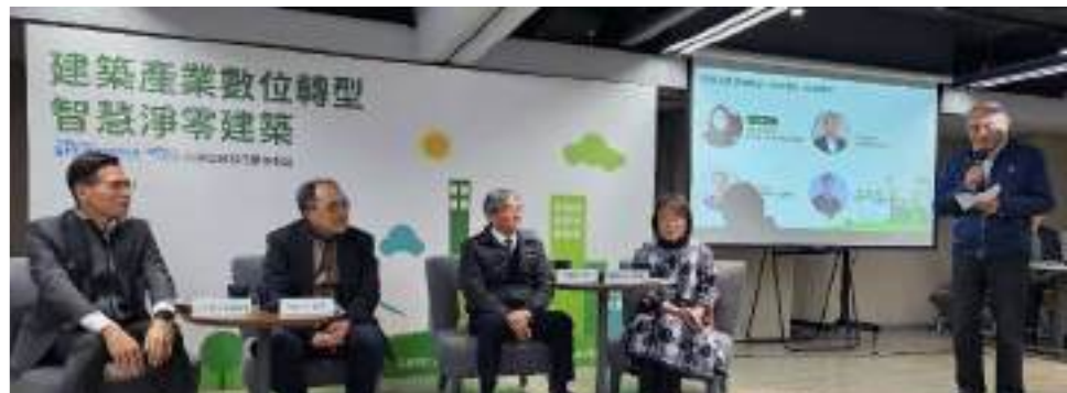
智慧建築產業論壇 Smart Building Industry Forum