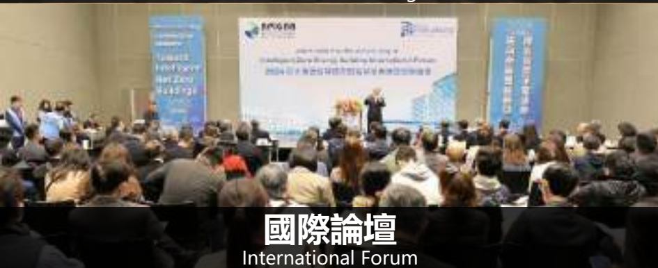
國際論壇 International Forum