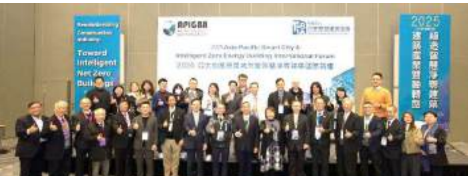
國際智慧建築高峰會 International Smart Building Summit